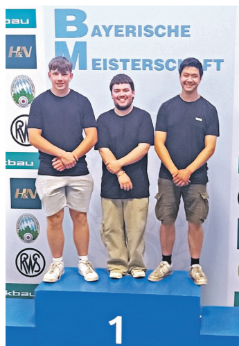
Schießen: SV Umpfenbach, Erfolge: Bayerischer Meister Luftpistole Junioren

Lesen Sie den vollständigen Beitrag auf www.meine-news.de/189721