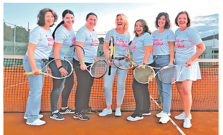
Tennis: TV Mömlingen, Erfolge: Tennis Frauen W40 / Meister Landesliga mit Aufstieg Bayernliga (4. Liga)