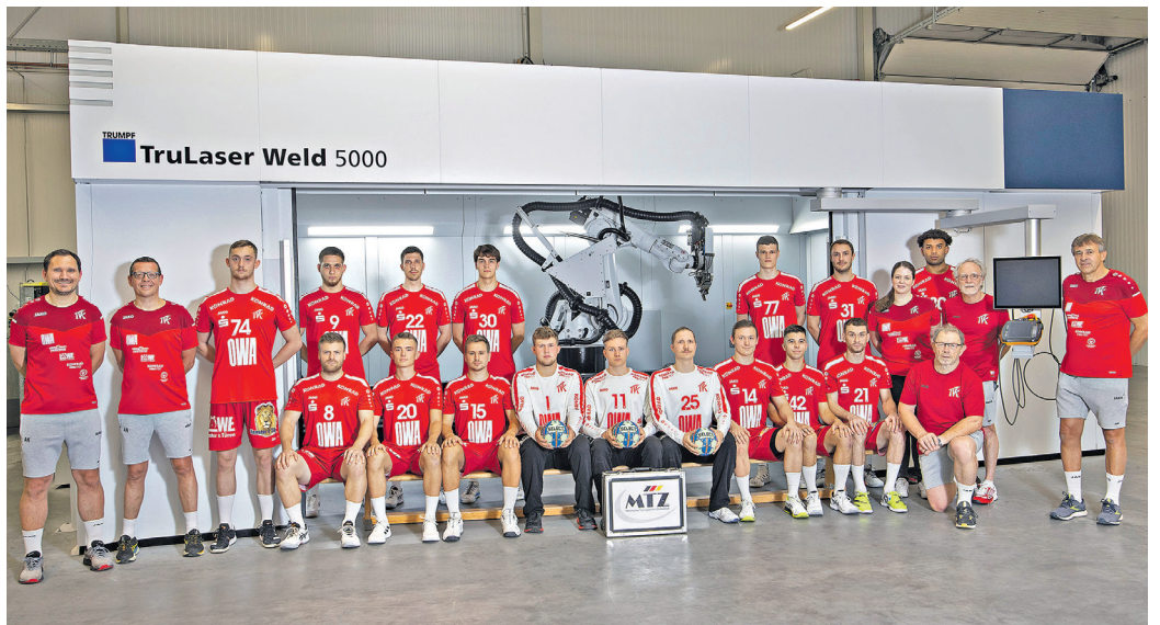
Handball: TV Kirchzell, Erfolge: Meister Regionalliga mit Aufstieg in 3. Liga (Herrenhandball)