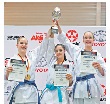
Karate „Kata“: SV UNSU Mömlingen, Erfolge: Deutscher Meister der Juniorinnen

• Tischtennis Senioren AK55 Weltmeister im Doppel